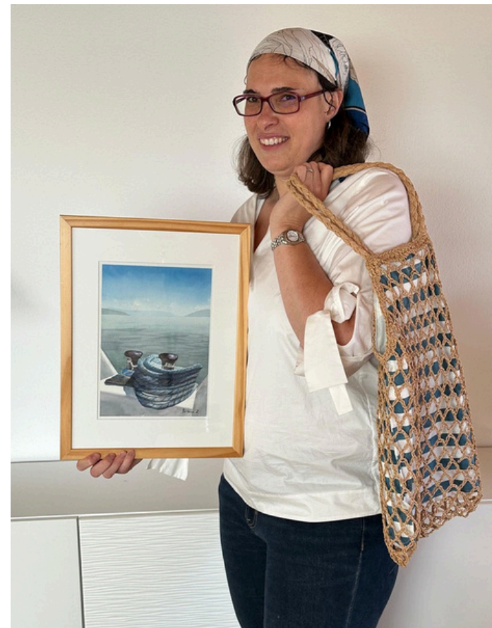
Larguer les Amarres 2023 Aquarelle - Papier Arches 19 x 27 cm