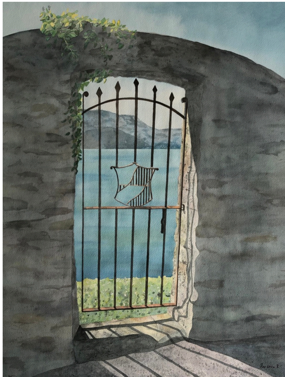
La Porte du Paradis 2021 Aquarelle - Papier Arches 42 x 56 cm