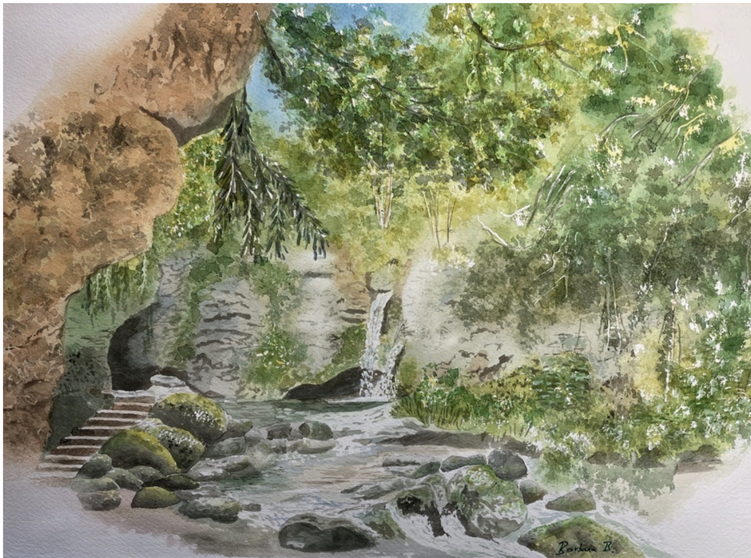
Oasis de Sérénité 2026 Aquarelle - Papier Arches 36 x 27 cm