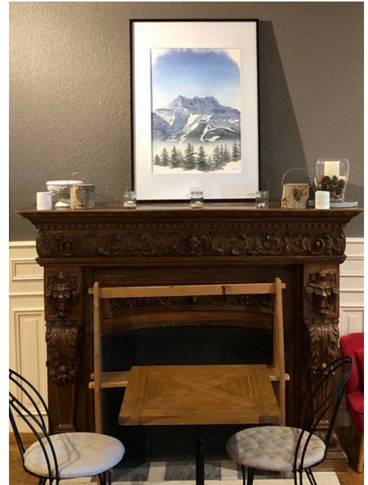
Grand Bol d'Air 2022 Aquarelle - Papier Arches 50 x 70 cm