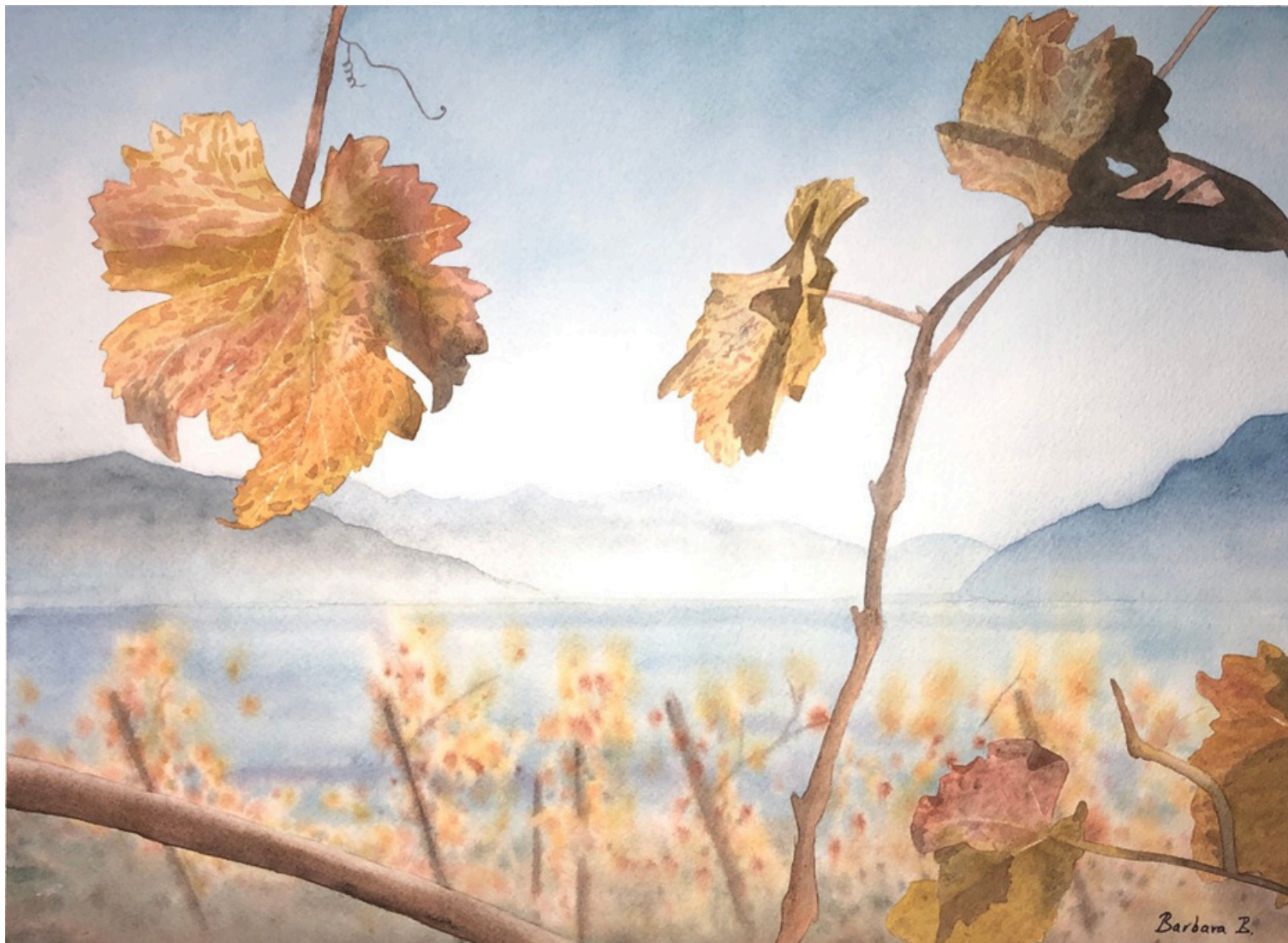
Douceurs à Rivaz 2020 Aquarelle - Papier Arches 36 x 27 cm