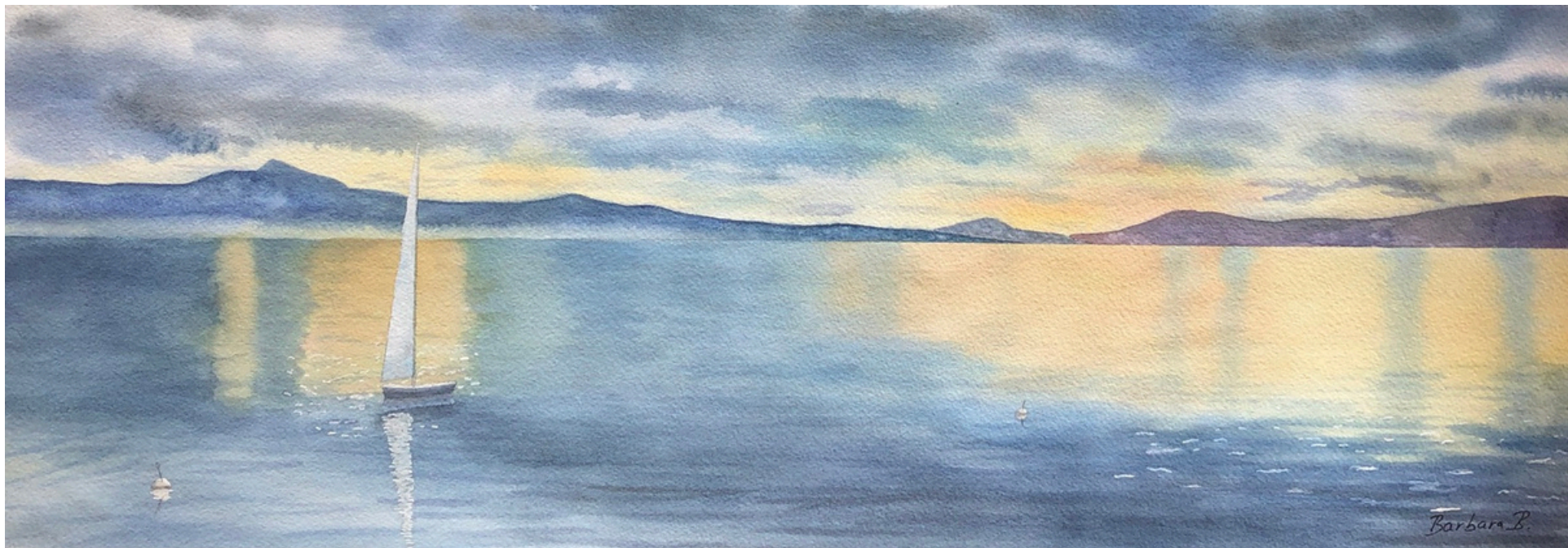
La Voile Dort 2022 Aquarelle - Papier Arches 56 x 19 cm