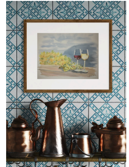
Apéro Time! 2023 Aquarelle - Papier Arches 36 x 27 cm