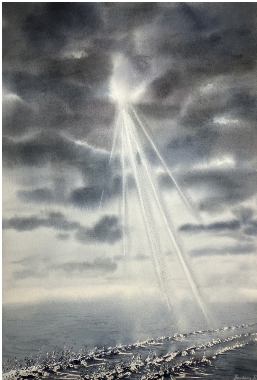
Vaguelettes Mystiques 2025 Aquarelle - Papier Arches 38 x 56 cm