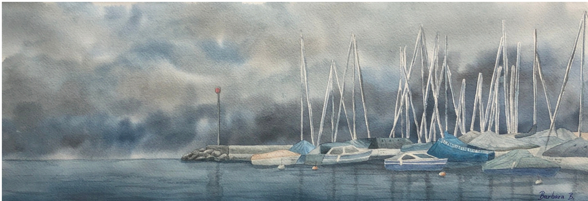
Le Chant des Mâts 2022 Aquarelle - Papier Arches 57 x 20 cm